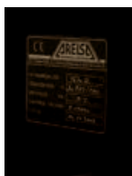
Placa características, marcado CE