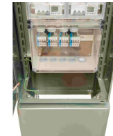
Espacio para conexiones