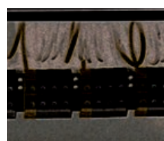
Bucles para medición