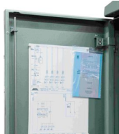
Esquemas plastificados, manual y garantía