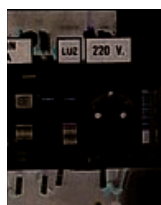
Toma de corriente