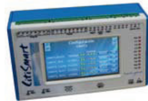
CITISMART® Terminal inteligente concebido para la gestión de la Smart City

Es una herramienta capaz de recoger el conjunto de datos de las instalaciones, organizarlos y transmitirlos a los centros de decisión de los diferentes servicios de la ciudad, facilitando además el acceso directo a la información a los ciudadanos.